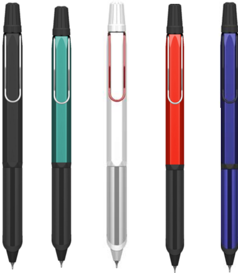
BLACK TT.TURQUOISE WHITE RED TT. RED NAVY